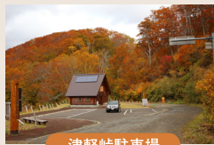
津軽峠駐車場 トイレあり・津軽峠バス停に隣接