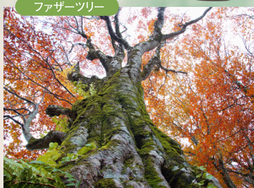
見晴らしがよいのでランチタイムに