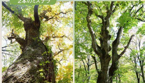
このあたりに、ミズナラの大木が2本ある