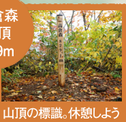
山頂の標識。休憩しよう