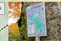
ここから 世界遺産地域に入る